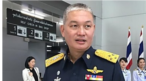
ราชกิจจานุเบกษา ประกาศ เรียกคืนเครื่องราชฯ ผู้พิพากษาถูกไล่ออกจากราชการ 3 ราย ป.ป.ช.เปิดทรัพย์สิน 'บักจ่อม' พัน สนช. รวย 28 ล้าน