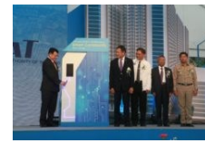
การทำเรืออัด 7.5 พันล้าน ย้ายชุมชนคลองเตย 1.2 หมื่นครัวเรือน เคลียร์พื้นที่พัฒนาเชิงพาณิชย์

รัฐวิสาหกิจ ประเภทสถาบันการเงินเฉพาะกิจ สังกัดกระทรวงการคลัง เปิดเผยว่า ผลงาน 3 ไตรมาส (มกราคม – กันยายน 2561) มีกำไรสุทธิ 104 ล้านบาท จากการดำเนินงานและการเร่งแก้ปัญหาหนี้ เทียบกับช่วงเดียวกันของปีก่อนที่ขาดทุนสุทธิ 57 ล้านบาท ซึ่งเป็นผลจากการปรับปรุงกระบวนการภายใน คาดว่าปี 2561 จะเป็นปีที่มีกำไรสุทธิที่สุดของ บตท. ตั้งแต่ก่อตั้งมา