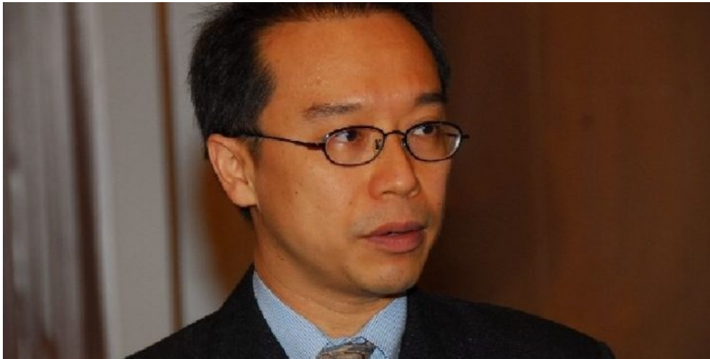
นักวิชาการชี้ปี '62 ศก.ไทยเจอปัจจัยเสี่ยงสูง คาดเล็กลงพุ่ง!