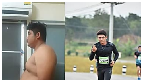
ระเบียบใหม่ขนส่ง 'พักใช้-เพิกถอนใบขับขี่' โทษปรับสูงสุด 2 แสนบาท มีผลแล้ว! ฮือฮา! หนุ่มออฟฟิศ ฝึยเคล็ดลับ 5 เดือน ลดได้ 40 กิโลฯ