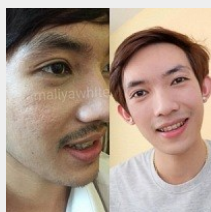
หลุมสิว...อุกกาบาต กลับมาเนียนกริบ แนะนำวิธีนี้