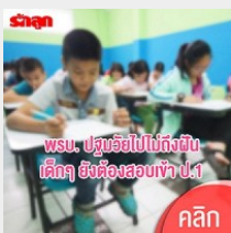
พรบ. ปรุรวัยไปไม่ถึงฝัน เด็กๆ ยังต้องสอบเข้า ป.1