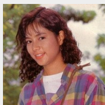
'ลงหลักปักฐานเมืองนอก' 5 อดีตนางเอก ห้างวงการ ใช้ชีวิตต่างประเทศ