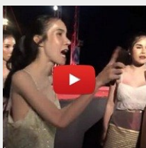
ดาเบิงกรรมการ ตัดสินใจ ชัดใจ ถามหาคำตอบแต่ไว้รว?