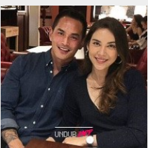
เรียกตรามาโครมใหญ่ "แมท" เปิดศักราชใหม่ ลงภาพคู่ "สงกรานต์"