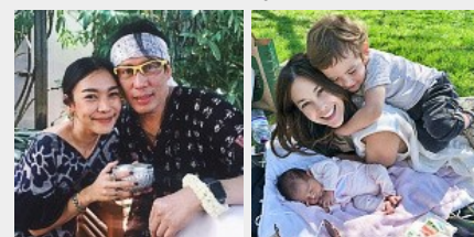
สายเลือดซูปตาร์ 5 คน บันเทิง หลายคนเพิ่งรู้ เป็นหลานแท้ๆ คนดัง