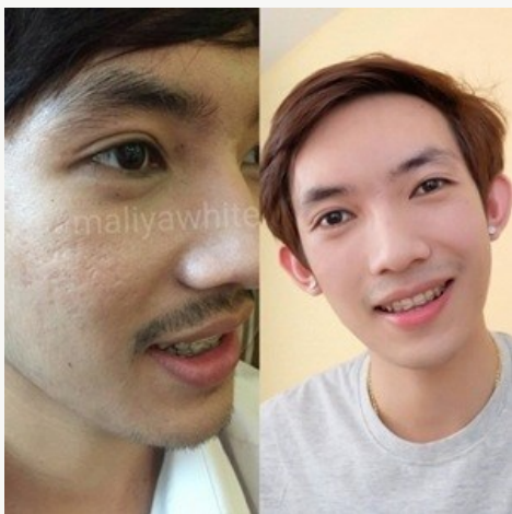
หลุมสิว...อุกกาบาต กลับมาเนียนกริบ แนะนำวิธีนี้