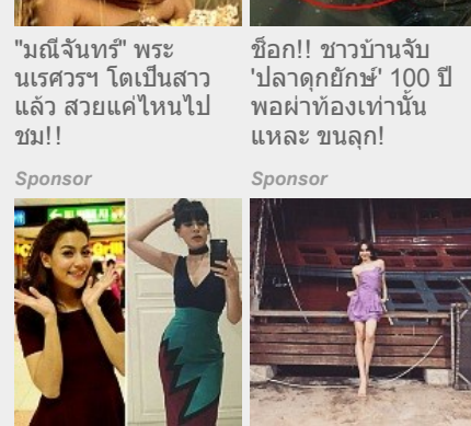
สงกรานต์ 6 ดารา อติตหุ่นเคยฟัง