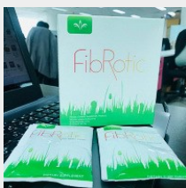
ดีท็อกซ์ ล้างลำไส้ Jeunesse ไฟโบรติก